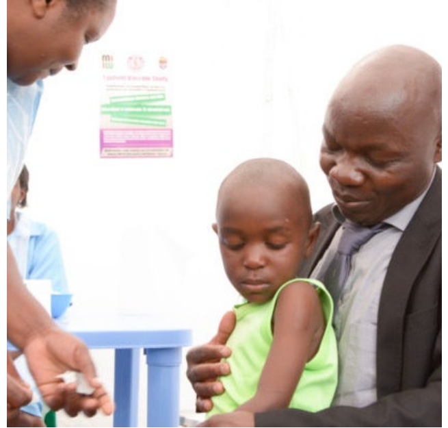
Sabin Vaccine Institute

Le vaccin antityphoïdique conjugué Typhar-TCV® a reçu la préqualification de l'Organisation mondiale de la Santé en décembre 2017.